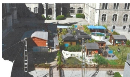
WWF-Ausstellung in Zürich

Hier in Gressier (Haiti) werden die Häuser unter der Leitung von Otto Hegnauer (40 Jahre Haitierfahrung) wieder aufgebaut.